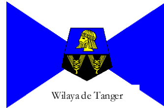
Wilaya de Tanger

Ministère de l'Énergie, des Mines, de l'Eau et de l'Environnement