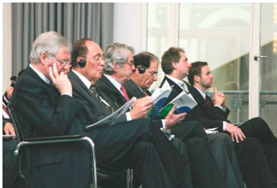
Ein hochrangiges internationales Publikum fand sich zum Wasserforum für die EMA-Region in der Handelskammer Hamburg ein.

Nach dem großen Erfolg des Wasserforums befindet sich die Follow-Up-Veranstaltung schon in Vorbereitung. Auch die regelmäßig stattfindenden Hamburger Wirtschaftstage sowie ausgewählte Workshops und Fachveranstaltungen deutschlandweit und in der EMA-Region sprechen für das breite EMA-Netzwerk sowie für den Erfolg der EMA als Business-Partner.