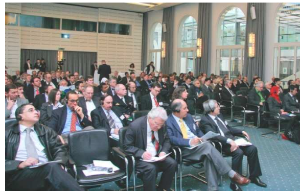
Die Veranstalter, die Vertreter der Stadt Hamburg sowie die Ehrengäste lesen mit großem Interesse die Konferenzbrochure.